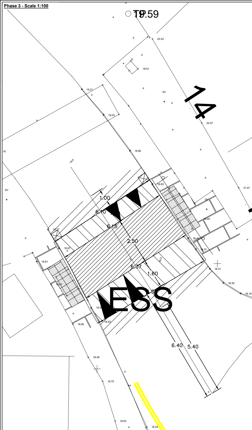
Phase 3 - Scale 1:100