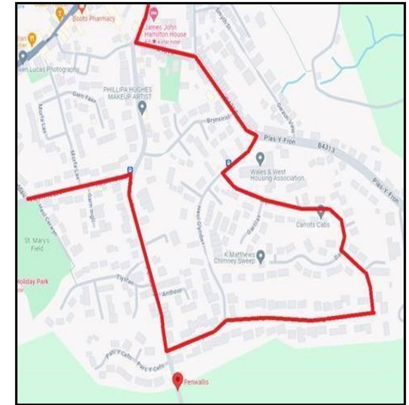
Bws Llwybr Arfaethedig

Yn y cynllun arfaethedig byddai'r bws yn galu gwasanaethu'r rhan fwyaf o'r cymdogaeth