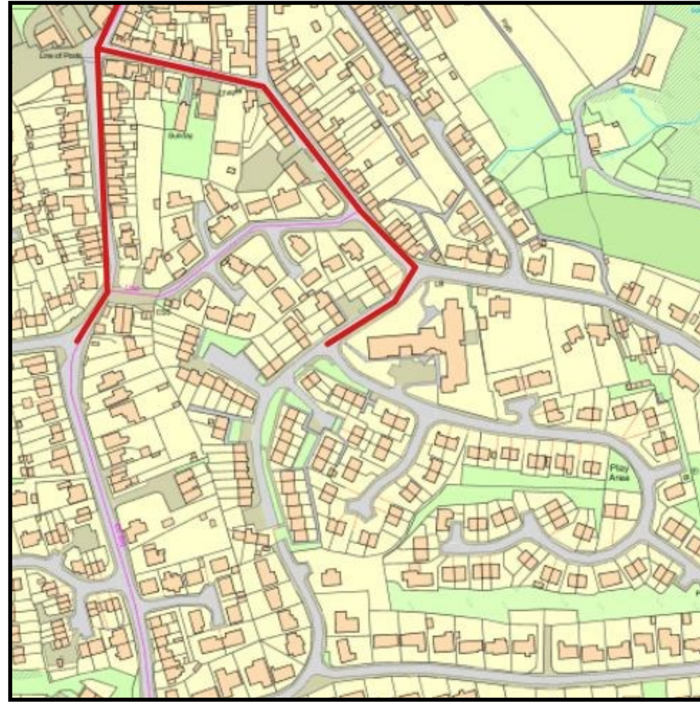
Bws Llwybr Presennol

Nid yw'r llwybr bysiau presennol yn cyrraedd ardal Penwallis yn llawn;