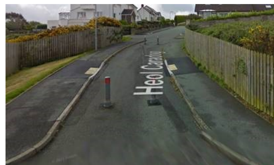
Rhwystrau presennol i'r gwasanaeth bysiau ar Heol Glyndŵr a Heol Caradog